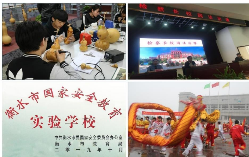
立足地域特色，传承优秀文化，以“玩”激趣、以趣冶情、以情化理、以理入“道”，在非遗和法治文化滋养下，将学校、社会、家庭的关爱化为成长动力

“爱”的温度，帮助学生将爱国情、报国志与勤奋学习、钻研专业、建设家乡、奉献社会的具体行动相联结，找寻到让人生出彩的成长支点。由于大部学生都有中考失利经历，他们中很多认为进职校是“无奈之举”，主观上很难尽快适应角色。也有部分