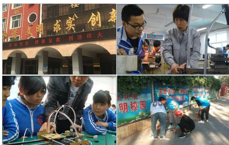
劳动最光荣！合格的社会主义建设者和接班人必须是热爱劳动、能以劳动成果为家国兴盛添砖加瓦的人。校园风尚、匠心笃行、身边小事都是铸业根基

离校前的毕业设计、就业后的母校巡访、毕业生代表返校演讲等，也都在潜移默化中提升着激励学生成才的正能量。(2)劳动滋养：职业学校担负着培养具有良好劳动精神风貌、正确劳动价值取向、高超劳动技能水平的社会主义建设者和接班人的光荣使命，针对个别学生不能吃苦、不愿劳动、不懂得珍惜他人劳动成果的现象，在通过多种