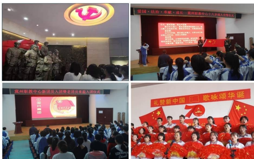
组织优秀团员到冀鲁豫省委边区党校展览馆过主题团日、举办十八岁成人仪式、重温入团誓词、歌咏礼赞新中国，爱的滋养让学生们心中涌动青春的豪情

将“文明风采”活动贯穿教育教学日常，绝不等同学校德育工作“换装”，需要围绕提升学生思想认识、政治觉悟、道德品质、文化素养等多方面风貌形成校本特色。特色从何处来？人民教育家于漪说：“教育事业是爱的事业，没有爱就没有教育。”中职学校、教师所有立德树人