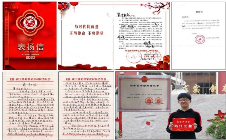
爱的生长需用爱的泉水浇灌，期待最大的回报是学生能够在社会需要时直面担当，疫情挡不住、遇挫志弥坚，他们每项成绩的获得，都是园丁的骄傲！

方式倡导劳动光荣、技能宝贵、创造伟大时代风尚同时，将劳动教育与实习实训、匠心养成训练以及校内外公益劳动、社会专业服务、专业竞赛备战等结合起来，增强了学生劳动成就感和以知识、技能提升劳动质量、建设美丽乡村的责任意识。(3)思政滋养：文化滋养解决了教育环境与氛围问题，劳动滋养让学生体悟到亲自动手、脚踏实地才能品味果实的甘甜，